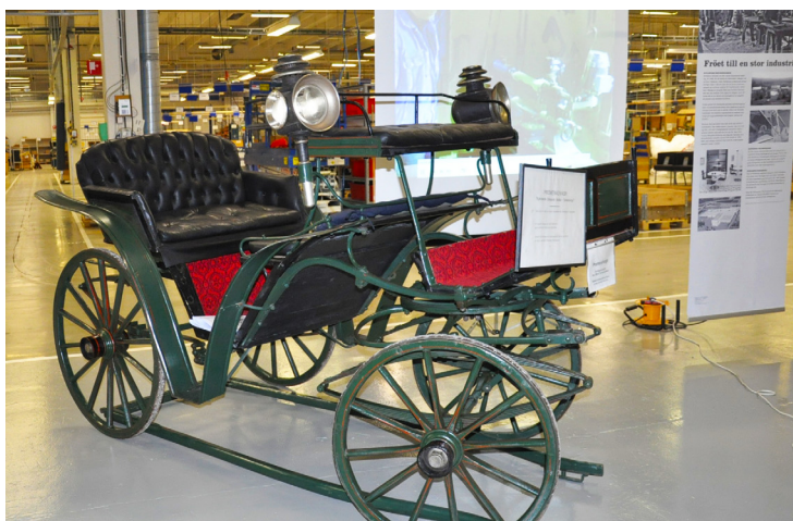
Vaggeby kommun värd för Möbelriksdagen 2015 på Kinnarps.