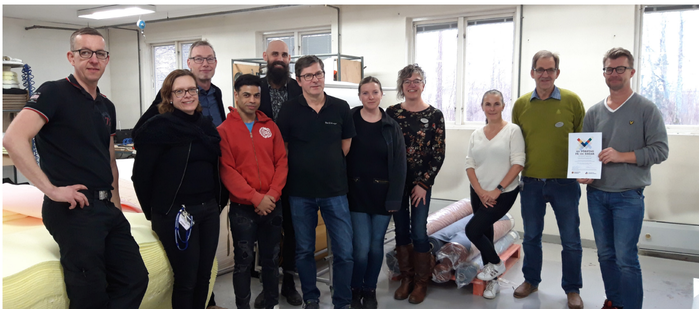
I kampanjen "101 företag på 101 dagar" besökte kommunanställda, politiker och näringslivspersoner olika företag. Här hos David design.